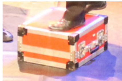
5) : BMO N° 238 Page 33 Événement : Les bons Becs en voyage de notes