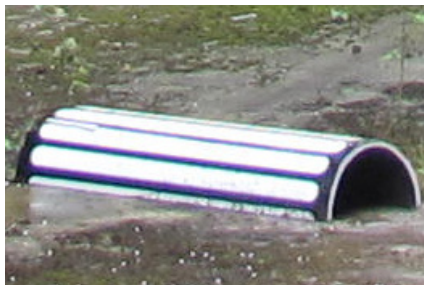
2) : BMO N° 236 Page 11 Événement : Portes ouvertes à l'usine Badin