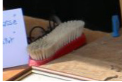
4) : BMO N° 237 Page 9 Événement : Journée du Patrimoine