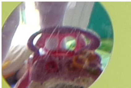
3) : BMO N° 239 Page 13 Événement : Carnaval à la crèche Les Elfes